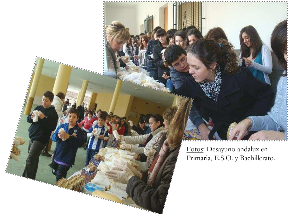
Fotos: Desayuno andaluz en Primaria, E.S.O. y Bachillerato.

Ofrecemos algunas cifras que dan una idea de la magnitud de esta actividad. Este año se han comprado 1500 bollitos de pan, se han utilizado 30 litros de aceite de oliva y 1500 unidades de bebidas variadas (batidos y zumos). Se ha contado con la colaboración de 25 madres y padres para la organización.