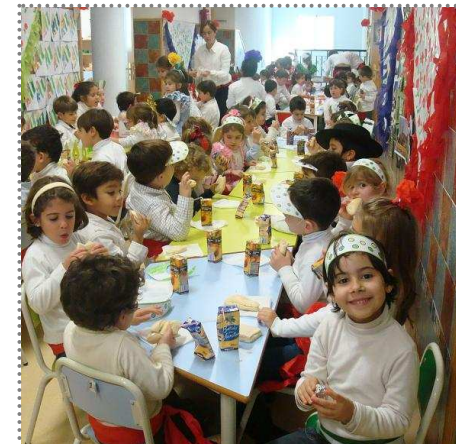
Foto: Desayuno andaluz en Infantil.

El encuentro, que tendrá lugar en el colegio, comenzará por la mañana con una Eucaristía y se extenderá hasta la tarde. Almorzaremos juntos, comprando la comida que cada familia