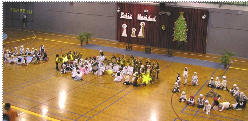
Foto: Festival de villancicos de Infantil.

Resultaron, a pesar de la lluvia, dos veladas magníficas en las que disfrutamos de las actuaciones de nuestros pequeños artistas.