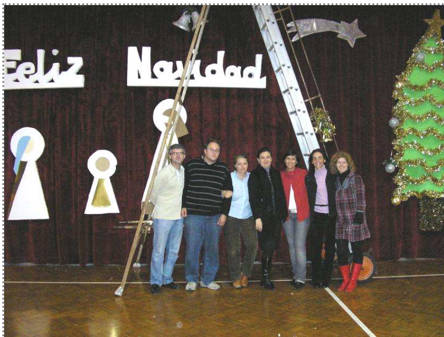
Foto: Grupo de colaboradores en la preparación de los festivales de villancicos.

En esta ocasión nuestra sección del personaje del mes no se centra en una persona en concreto, sino en todos vosotros, los padres y las madres que siempre estáis ahí, gracias a los que se hacen muchas cosas en el centro.